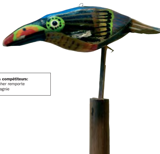
L'oiseau, cible de tous les compétiteurs: celui qui parvient à le toucher remporte le titre de Roy de la Compagnie

Il existe une autre distinction plus aléatoire, celle qui correspond au Roy de la Compagnie. Contrairement au bureau qui est élu en assemblée générale par tiers et pour une durée de trois ans, le Roy remporte ses galons lors d'un concours qui se déroule traditionnellement pendant la première semaine de mars et qui regroupe tous les membres de la Compagnie. L'énoncé du défi est relativement simple: il faut viser un oiseau de un pouce de haut pour un pouce de large, le tout à cinquante mètres! Pas facile à exécuter... L'ordre de passage a ainsi forcément son importance